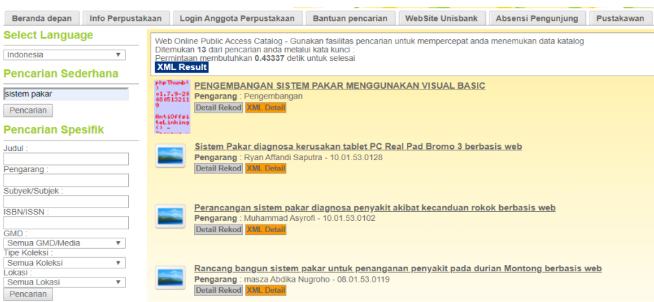
Gambar 2 Menu pencarian buku pada web perpustakaan.