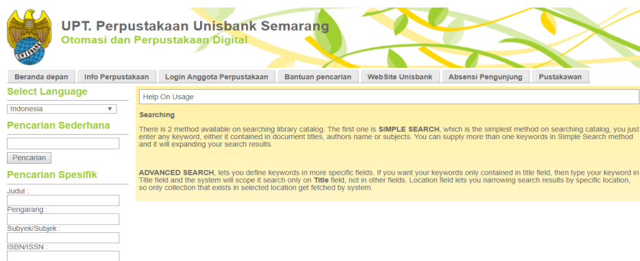
Gambar 1 Tampilan web UPT Perpustakaan Unisbank.