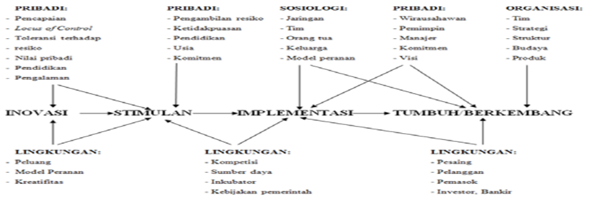
Gambar 3.1. Proses Kewirausahaan

Sumber: Carol Moore (1986) dalam Saputra (2011)