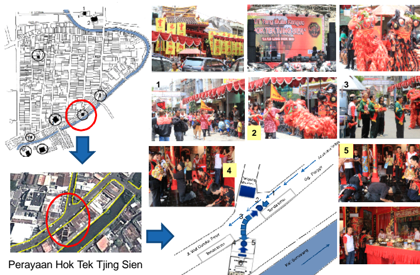
Gambar: Simbol penghormatan, yang dijadikan bagian dari atraksi wisata budaya

Keberadaan/kehadiran makna ruang beserta konsepnya tersebut, selama ini kurang dipahami oleh penyusun kebijakan. Hal ini dikarenakan tekanan kebijakan Orde Baru telah membuat masyarakat melakukan segala aktivitas yang berbau budaya Tionghoa secara terselubung, sehingga banyak pihak yang tidak mengetahui, sementara produk perencanaan yang ada lebih banyak dilakukan dengan pertimbangan desain tingkat tinggi yang lebih banyak menggunakan hasil pemikiran perencana dan mengabaikan produk desain masyarakat lokal. Kondisi inilah yang kemudian memunculkan beberapa konflik aktivitas berdimensi ruang dan waktu.