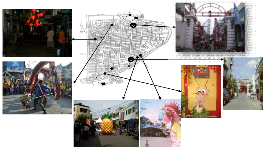
Gambar 2: Simbol perlindungan, yang dijadikan bagian dari atraksi wisata budaya