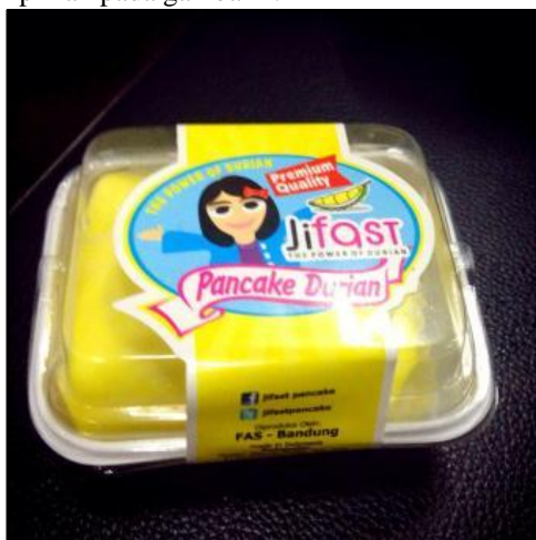
Gambar 1. Produk Jifast Pancake Durian

Contoh sampel produk dalam penelitian ini ditampilkan pada gambar 1.