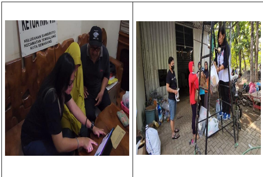
Gambar 2 Kegiatan Pembuatan Konten Video