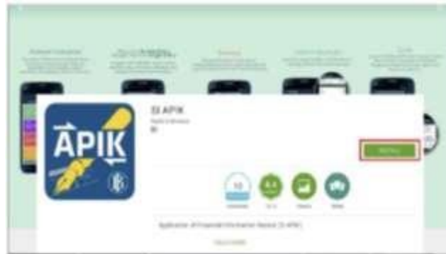
Gambar 2 Instalasi Aplikasi SI APIK