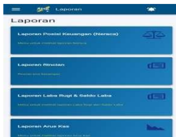
Gambar 4 Fitur Sistem Akuntansi