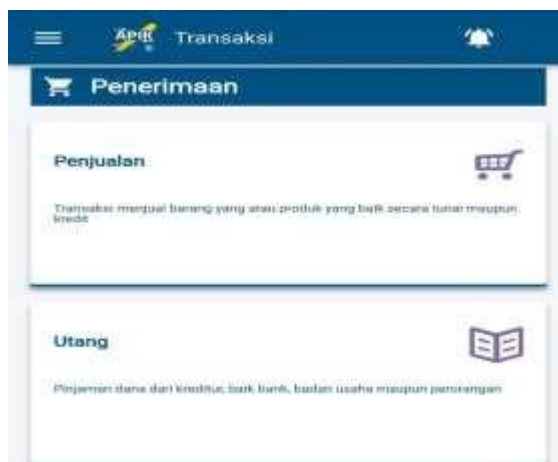
Gambar 5 Entry Data Transaksi