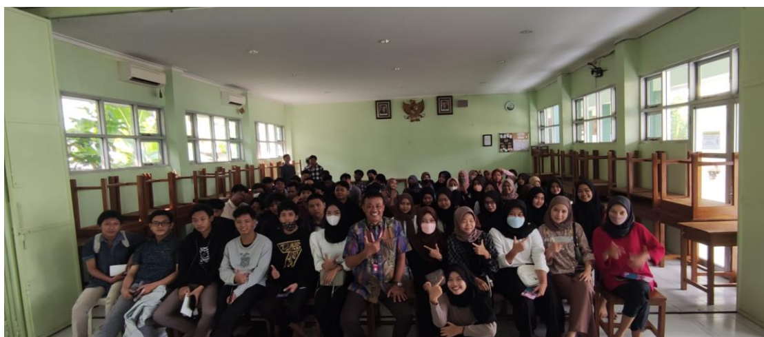
GAMBAR 3 : DOKUMENTASI KEGIATAN PENGABDIAN MASYARAKAT