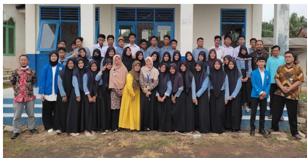
GAMBAR 4. FOTO BERSAMA TIM PKM DAN SISWA SISWI

SMP Insan Kreasi Bogor, dilaksanakan pada tanggal 19 sampai dengan 21 Oktober 2022. SMP ini beralamat di Jl. Parung Panjang - Tenjo RT 01 / RW 07, Batok, Tenjo, Batok, Kec. Tenjo, Kabupaten Bogor, Jawa Barat 16370. Gambar 4 merupakan gambar tim PKM Bersama dengan siswa dan sswi.