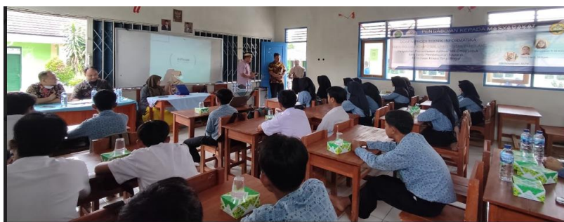
GAMBAR 2. PENYAMPAIAN MATERI MICROSOFT OFFICE.