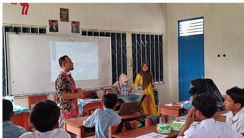
GAMBAR 3. KEGIATAN TANYA JAWAB.

Sejumlah minimal 30 Orang yang terdiri mayoritas siswa-siswi. Para peserta sangat antusias berkomunikasi dengan tanya. Beberapa pertanyaan yang berhubungan dengan Microsoft word yaitu “bagaimana merubah halaman di setiap lembaran kertas”. “Bagaimana merubah font dan ukuran dari huruf”. Serta pertanyaan terakhir yaitu “bagaimana mencetak lembaran tugas yang telah dikerjakan”. Gambar 3 merupakan aktifitas tanya jawab dengan siswa dan siswi.