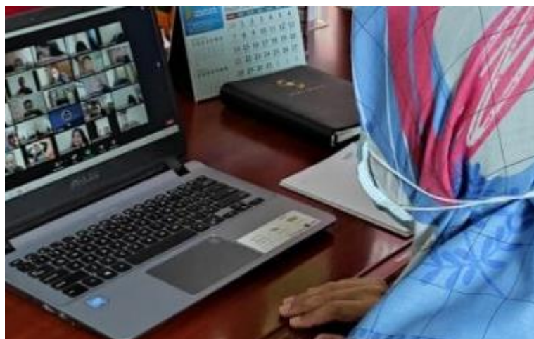
GAMBAR 2. PENDAMPINGAN MENGGUNAAN ZOOM ATAU MEET