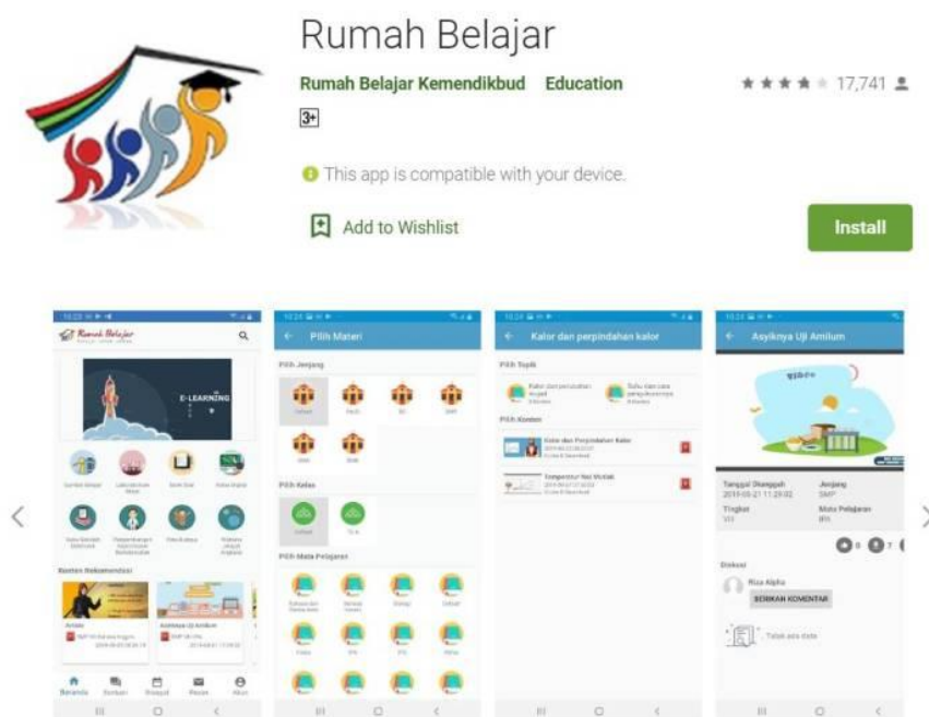
GAMBAR 4. LAMAN RUMAH BELAJAR

Tersedia pula beragam fitur menarik, seperti Sumber Belajar, Laboratorium Maya, Kelas Maya, Peta Budaya, dan sebagainya.