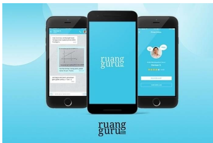
GAMBAR 6. LAMAN APLIKASI RUANG GURU

Aplikasi bimbingan belajar online terlengkap di Indonesia Ruangguru ( bimbel.ruangguru.com ). Ruangguru merupakan salah satu bimbingan belajar online terlengkap di Indonesia yang telah hadir berbasis aplikasi. Aplikasi Ruangguru menyediakan beragam fitur bermanfaat untuk pembelajaran daring, antara lain: