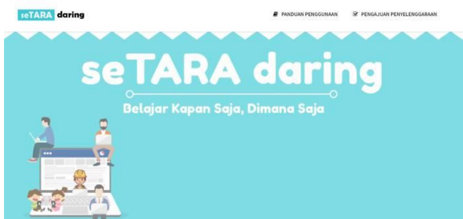
GAMBAR 5. LAMAN SETARA DARING

Aplikasi pembelajaran daring terbaik di Indonesia seTARA Daring ( setara.kemdikbud.go.id ). seTARA daring adalah sebuah aplikasi Learning Management System (LMS) yang dirancang untuk pembelajaran jarak jauh , dengan tagline-nya 'Belajar Kapan Saja, Dimana Saja'.