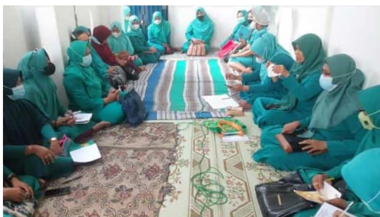
GAMBAR 3. MEMBERIKAN CERAMAH TENTANG SEKOLAH DARING