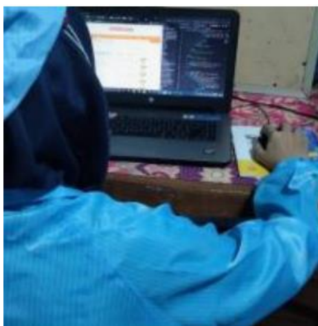
GAMBAR 2. PESERTA PENDAMPINGAN DAN PELATIHAN PKK DAWIS MELATI SEDANG PRAKTEK