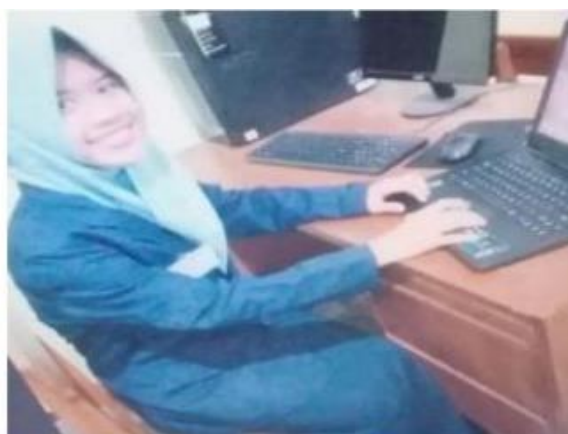
GAMBAR 1. PESERTA PENDAMPINGAN DAN PELATIHAN PKK DAWIS MELATI.

Dari tabel 1 sebagai panduan, maka tim pengabdian masyarakat kemudian melaksanakan pendampingan dan pelatihan yang telah direncanakan. Gambar 1 dan Gambar 2 merupakan salah satu hasil tangkapan kamera dari tim pengabdian masyarakat saat kegiatan pendampingan dan pelatihan dilaksanakan.