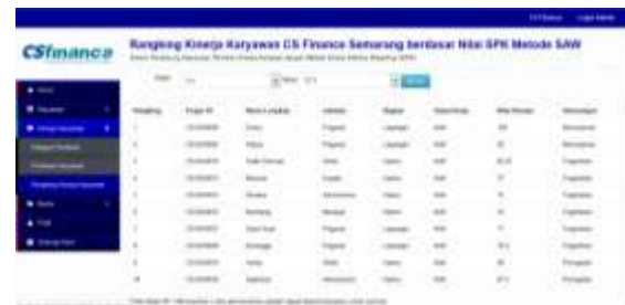
Gambar 4. Implementasi User Interface Halaman Rangkings Kinerja Karyawan

Halaman berikut merupakan hasil implementasi dari perancangan halaman rangking kinerja karyawan pada Gambar 4.