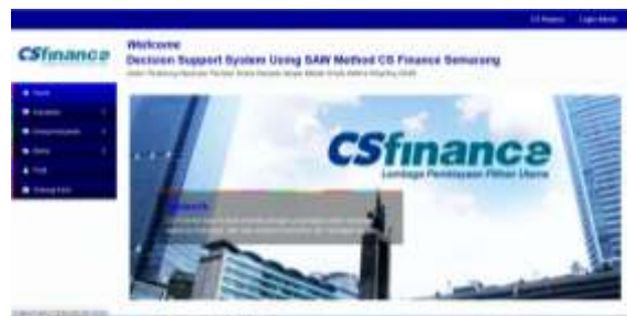
Gambar 3. Implementasi User Interface Halaman Utama/Home Karyawan

Halaman berikut merupakan hasil implementasi dari perancangan halaman utama/home karyawan pada Gambar 3.