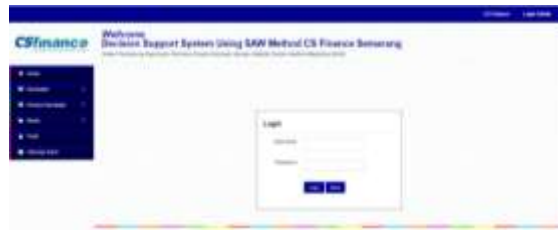
Gambar 5. Implementasi User Interface Halaman Login Admin

Halaman berikut merupakan hasil implementasi dari perancangan halaman login admin pada Gambar 5.