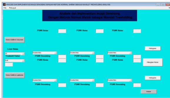
Gambar 2. Tampilan halaman utama program

Pada tahap implementasi sistem ini merupakan tahap meletakkan sistem supaya siap dioperasikan. Program aplikasi image denoising ini merupakan aplikasi yang sepenuhnya dibuat dengan software pemrograman matlab dengan fungsi-fungsinya. Aplikasi ini menampilkan cara menambahkan serta menghilangkan noise pada citra yang berformat bitmap dengan skala keabuan. Serta hasil dari perbandingan cara penghalusan noise dengan metode daubchies,coiflet and symlet .