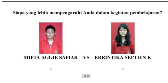
Gambar 2. Inputan Pemilih

Halaman inputan pemilih dijadikan halaman index dalam aplikasi ini. Pada halaman ini akan disajikan dua mahasiswa yang dapat dipilih oleh pengakses web. Dua mahasiswa yang tampil dalam halaman ini diambil secara random dari tabel mahasiswa. Untuk memudahkan pemilih dalam menentukan keputusan, diberikan informasi berupa nama dan foto mahasiswa yang dapat dipilih. Hasilnya dapat terlihat seperti pada gambar 2.